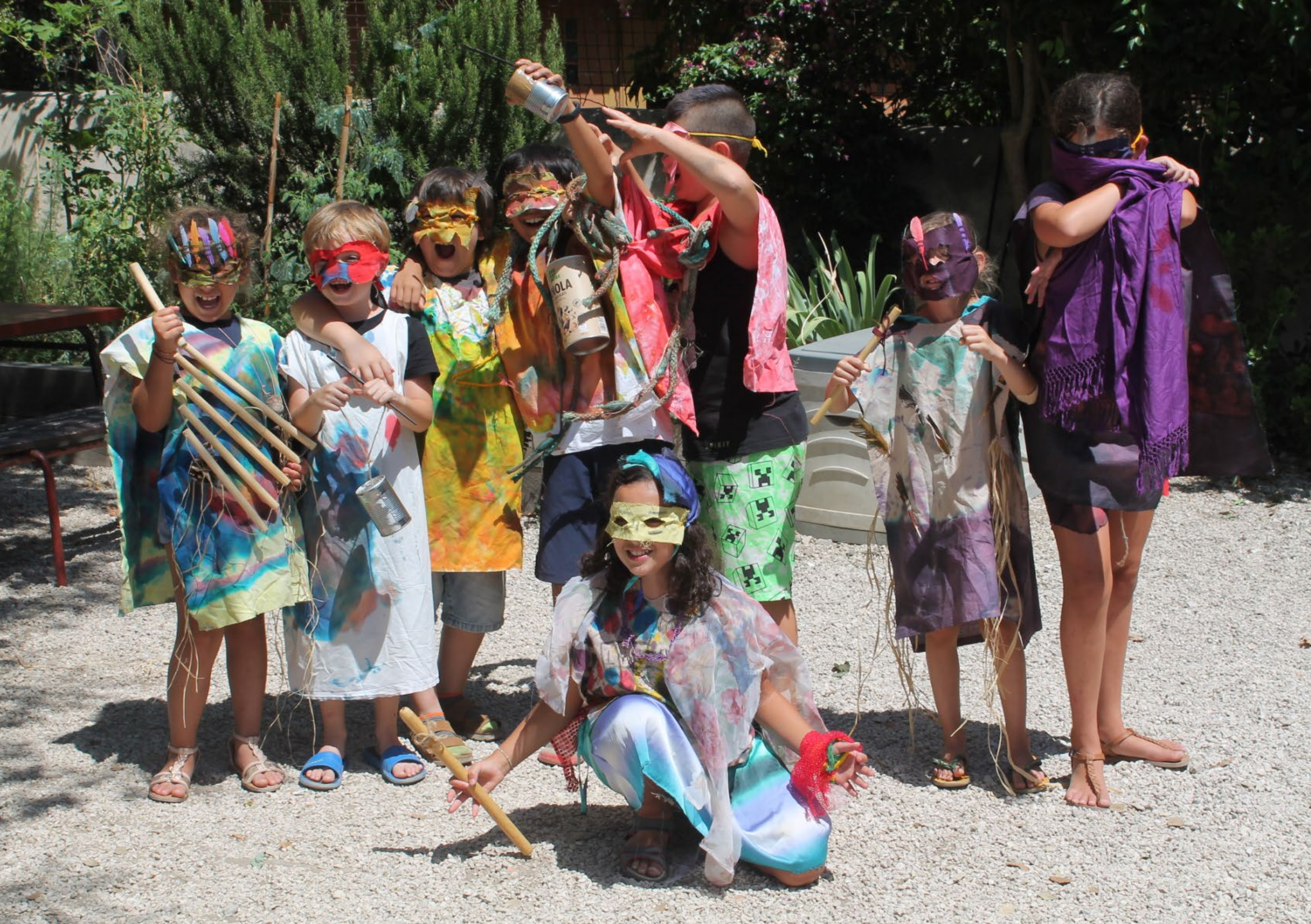
Photo de groupe issue de l'atelier "Mélomonstres" Centre social d'Endoume à Marseille, été 2023